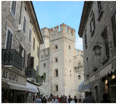
Trivelige smug i Sirmione