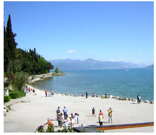
Strender for kropp og sjel