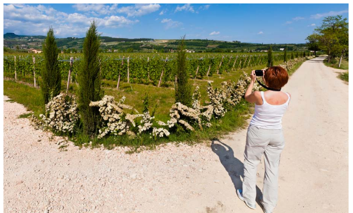
Vi smaker på godsakene til Villa Novare