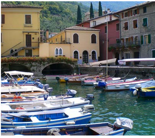
Fargerike båter og arkitektur